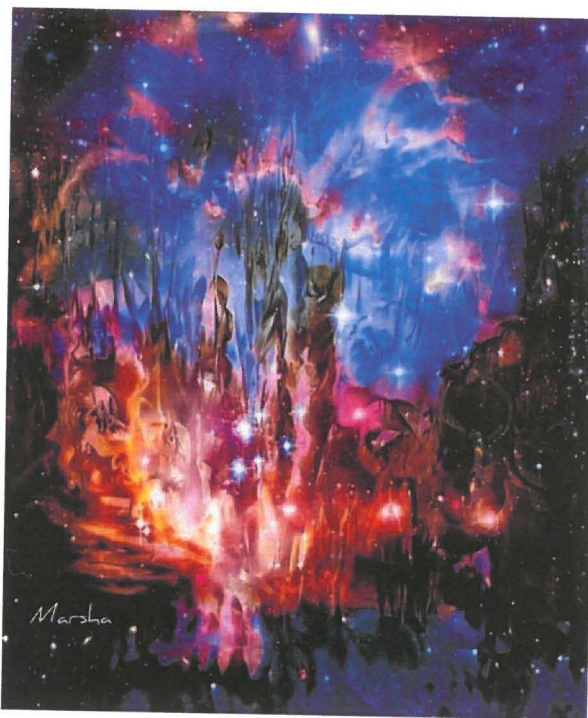
Ilustrácia Katarína Marsovszka