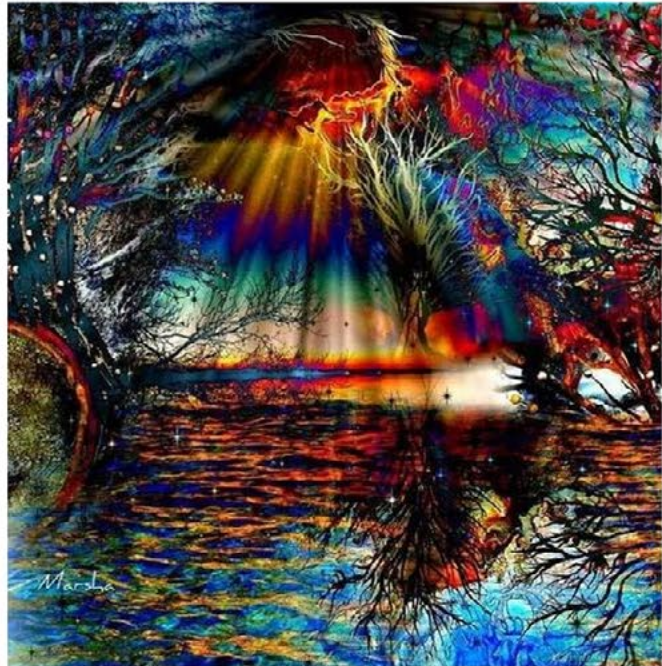
Ilustrácia: Katarína Marsovszká

Raz budú také, ako vy. Tak budte ľudskí k sebe..